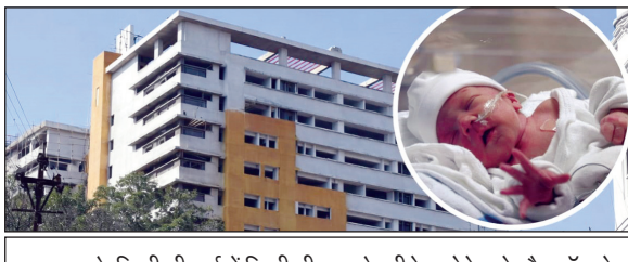
अस्पताल के किसी भी वार्ड में किसी भी तरह के कीड़े मकोड़े, चूहे और कॉकरोच मिलना खतरनाक है. खासकर के बच्चों और एनआईसीयू वार्ड में, चूहे सीधे तौर पर बच्चों के किसी अंग को कुतर सकते हैं. वहीं इनसे लाइस्टेरोसिस और रेट बाइट फीवर जैसा संक्रमण हो सकता है. जो खतरनाक है. इसी कारण एनआईसीयू वार्ड में खासकर के खाने के सामान लाने की भी मनाही होती है. जिससे यहां चूहे, कॉकरोच या अन्य कीड़े मकोड़े न आ सके.

इस बीच जिले के अस्पतालों में नवजातों की सुरक्षा को लेकर विशेष ध्यान देना शुरू कर दिया गया है. शनिवार को नवभारत रिपोर्टर ने हमीदिया अस्पताल में नवजातों की सुरक्षा को बरती जा रही सावधानी को लेकर अस्पताल अधीक्षक से पूछा- पेस्ट कंट्रोल