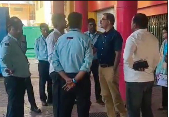
रिजर्व बैंक ऑफ इंडिया सहायक पद परीक्षा का मामला

नवभारत प्रतिनिधि भोपाल, 11 अप्रैल. दानिश कुंज कोलार रोड स्थित राजीव