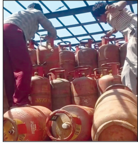
यह सिलेंडर में गैस कम निकलने का मामला अयोध्या बायपास स्थित सैनी गैस एजेंसी के लिए सप्लाई किए जा रहे

नवभारत संवाददाता भोपाल, 11 अप्रैल. राजधानी में गैस की समस्या से जहां जनता जुझ रही थी, इससे राहत देने के लिए प्रशासन लगातार कार्रवाई करता आ रहा है. इससे जनता को राहत मिलती, उससे पहले गैस सिलेंडर से गैस चोरी का मामला सामने आया है.