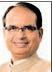
शिवराज सिंह चौहान

प्रधानमंत्री नरेंद्र मोदी जी के नेतृत्व में बीते 12 वर्षों में भारतीय कृषि एक नए दौर में प्रवेश कर चुकी है। पहले हमारी सबसे बड़ी चिंता यह थी कि देश में अनाज की कमी न हो, किसी तरह भूख से बचाव हो जाए। आज मोदी जी की दूरदर्शिता और किसान-हितैषी नीतियों ने कृषि को सिर्फ उत्पादन का क्षेत्र नहीं रहने दिया, बल्कि किसान की समृद्धि, जोखिम-सुरक्षा, पोषण सुरक्षा, हरित तकनीक और ग्रामीण विकास का समन्वित आधार बना दिया है। हरित क्रांति के बाद पहली बार नीतियों का फोकस केवल कितना उत्पादन पर नहीं, बल्कि किसान की वास्तविक आय कितनी, खेती कितनी टिकाऊ, और ग्रामीण अर्थव्यवस्था कितनी मजबूत पर आ गया है। इसी सोच से दलहन-कृषि मिशन, कॉटन मिशन, प्राकृतिक खेती मिशन, प्रधानमंत्री धन-धान्य कृषि योजना, खेत बचाओ अभियान, डिजिटल कृषि और शोध-उद्योग-संयोजक; सबको एक ही व्यापक दृष्टि से जोड़ा जा रहा है। आज भारत खाद्यान्न उत्पादन में 3765.63 लाख टन के रिकॉर्ड स्तर पर है, जो देश के इतिहास में सबसे ज्यादा है। धान, गेहूँ, मक्का, दालें और तिलहन- सभी में