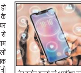
उड़द करोड़ यूजर्स को असुविधा हुई है।

चेट सिर पर लगी हो तो पैर पर पट्टी क्यों बांधी जाए? ऐसा ही हो रहा है। नीट परीक्षा से पहले 'टेलीग्राम' को 22 जून तक के लिए ब्लॉक किया गया। गत 3 मई को हुई नीट परीक्षा के पेपर लीक हो जाने से अब यह परीक्षा फिर 21 जून को नए सिरे से ली जा रही है। इस बार पेपर लीक न होने पाए इसलिए तमाम सावधानी बरती जा रही है जैसे कि प्रश्नपत्र तैयार करने वालों को एक जगह रखकर उनके बाहरी संपर्क पर पूरी तरह रोक लगा देना, एयरफोर्स के विमानों से पेपर फ्लाइंग। प्रधानमंत्री कार्यालय की देखरेख में ऐसे उपाय होना गलत नहीं है। टेलीग्राम पर कुछ लोगों ने फर्जी प्रश्नपत्र बनाकर इसे पुनर्परीक्षा का होने का दावा किया। नीट परीक्षा लेने वाले एनटीए ने इस तरह के दावे टुकरा दिए और कहा कि पेपर नहीं फूटा है। इसे देखते हुए केंद्र सरकार ने टेलीग्राम पर बंदी लगा दी। टेलीग्राम पर किए गए दावे असत्य हैं यह सिद्ध करना जब संभव है, तो फिर उस पर बंदी क्यों लगाई गई? सीबीआई जांच में पता लग चुका है कि 3 मई के प्रश्नपत्र के भंगालो को एनटीए से संबंधित परीक्षकों ने ही लीक किया था। 2024 में भी कुछ स्थानों पर हुए पेपर फूट प्रकरण में स्ट्रॉन रुम के कर्मचारियों