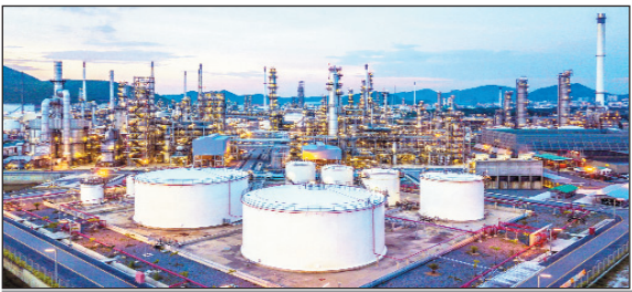
यूरोप के देश को तेल खरीदना है, तो उन्हें अनुरोध करना होगा

इस परियोजना को करीब 300 अरब डॉलर यानी लगभग 25 लाख करोड़ रुपये के निवेश के साथ अमेरिका के इतिहास के सबसे बड़े ऊर्जा सौदों में से एक माना जा रहा है. ट्रंप ने अपने सोशल मीडिया प्लेटफॉर्म टूथ सोशल पर इस परियोजना को