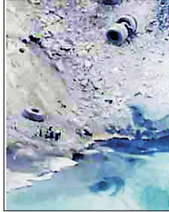
हादसे में वाहन चला रहे ऑपरेटर

नवभारत न्यूज सिंगरौली 19 जून। नवानगर थाना क्षेत्र स्थित अमलोरी कोयला खदान में आज शुक्रवार की तड़के हुए दर्दनाक हादसे ने एक बार फिर खदानों में सुरक्षा व्यवस्था को कठघरे में खड़ा कर दिया है। सुबह करीब 4 बजे ओबी कार्य में लगा एक होलपैक वाहन अनियंत्रित होकर लगभग 100 फीट गहरी खाई में जा गिरा।