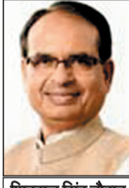
शिवराज सिंह चौहान

प्रधानमंत्री नरेन्द्र मोदी जी के नेतृत्व में बीते 12 वर्षों में भारतीय कृषि एक नए दौर में प्रवेश कर चुकी है. पहले हमारी सबसे बड़ी चिंता यह थी कि देश में अनाज की कमी न हो, किसी तरह भूख से बचाव हो जाए. आज मोदी जी की दूरदर्शिता और किसान-हितैषी नीतियों ने कृषि को सिर्फ उत्पादन का क्षेत्र नहीं रहने दिया, बल्कि किसान की समृद्धि, जोखिम-सुरक्षा, पोषण सुरक्षा, हरित तकनीक और ग्रामीण विकास का समन्वित आधार बना दिया है. हरित क्रांति के बाद पहली बार नीतियों का फोकस केवल किसान उत्पादन पर नहीं, बल्कि किसान की वास्तविक आय कितनी, खेती कितनी टिकाऊ, और ग्रामीण अर्थव्यवस्था कितनी मजबूत पर आ गया है.